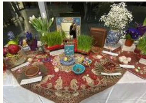
Découvrez la table de haft-seen dans l'entrée de l'école

Jedi 13 Mars -17h30 à 19h30 Face painting, spectacle musicale, et des spécialités Iraniennes à déguster! Venez nombreux! Face painting, music, kids' activities, Iranian food specialties. Everyone welcome!