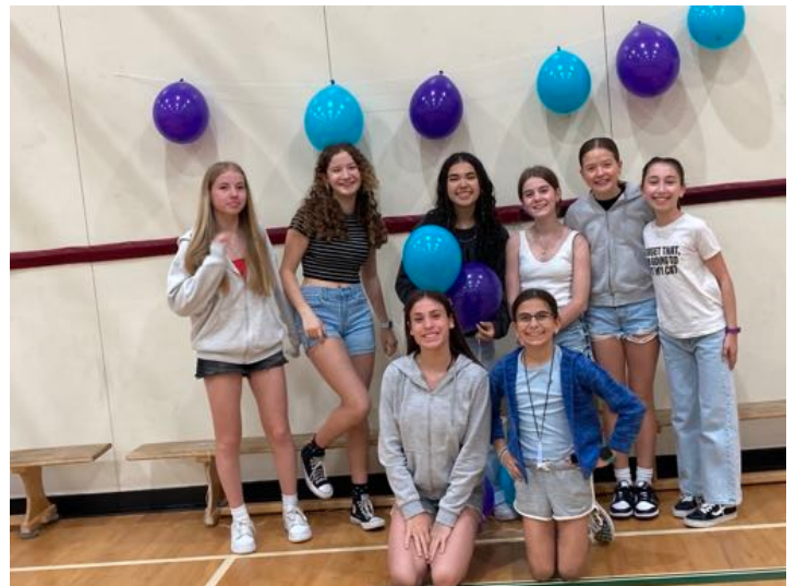
Danse des 7e année organisée par les élèves. Bravo !