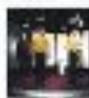
La découverte de télétransportation dans un laboratoire