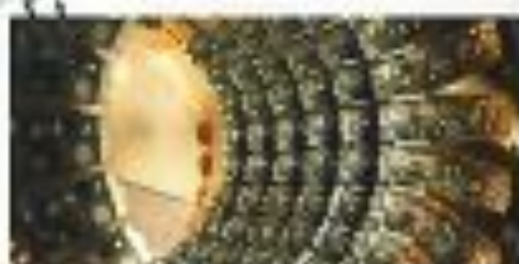
L'existence d'un ordinateur quantique

C'est une partie de la science qui a été développée par une partie de la théorie Quantique, par exemple, mathématiquement aux côtés de la physique classique, ce qui nous donne l'impression qu'elle nous la pour les choses !