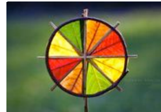
sculpture de Richard Schilling

mardi, du 28 avril au 2 juin (6 semaines) 15h00 à 17h00 - 2 heures De la 2 ième à la 4 ième année Prix : $95 matériaux compris. Date limite d'inscription : 21 avril 2015